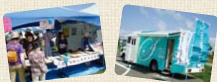
【乳がん】40歳以上の女性で1年以内に検診を受けていない方(先着40名様) 【肺がん】20歳以上の男女で1年以内に検診を受けていない方(先着60名様)