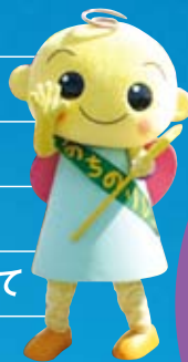
がん啓発キャラクター ふっぴー

参加者それぞれが交代でタスキをつながながら歩き、 生きる希望や勇気が生まれることを目指します。 どなたでも参加出来るチャリティイベントです。 ”命の大切さ” ”予防・早期発見の大切さ”を地域一丸となって 社会に訴え、一緒に歩いて生(行)きませんか？